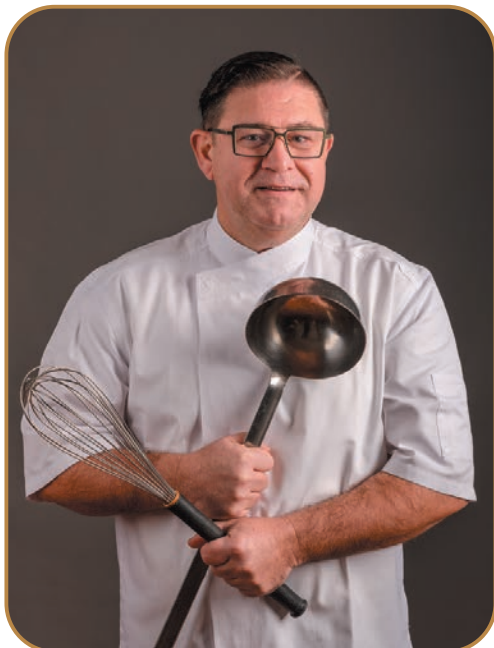
Donderdag 9 maart Landgoed den Oker