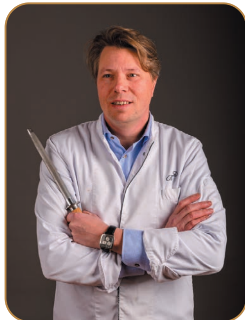
Donderdag 9 maart De Baronie