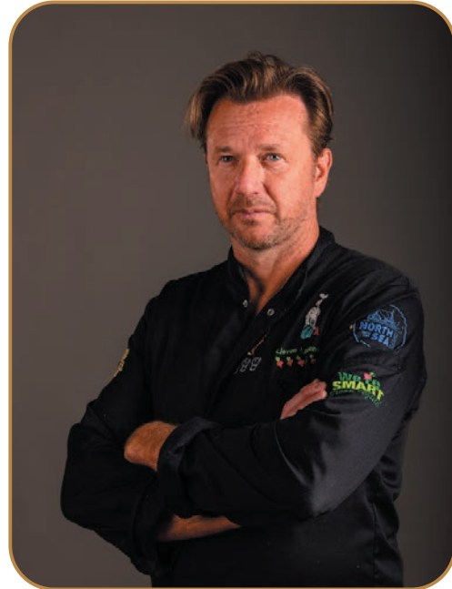
Woensdag 8 maart 't Aards Paradijs