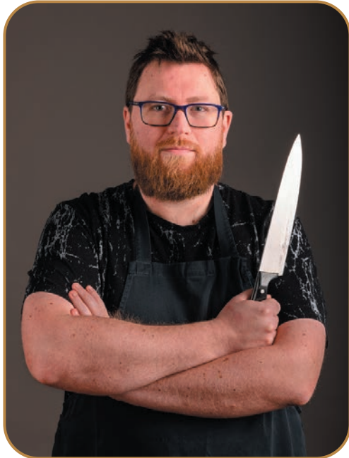
Dinsdag 7 maart Lijn58