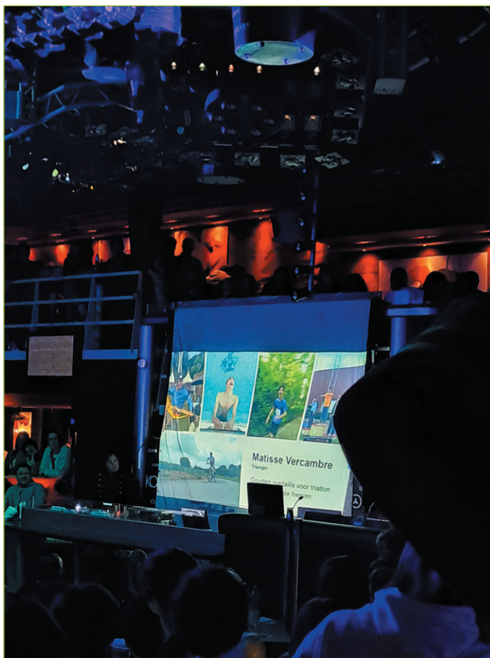
De Kokorico was the place to be