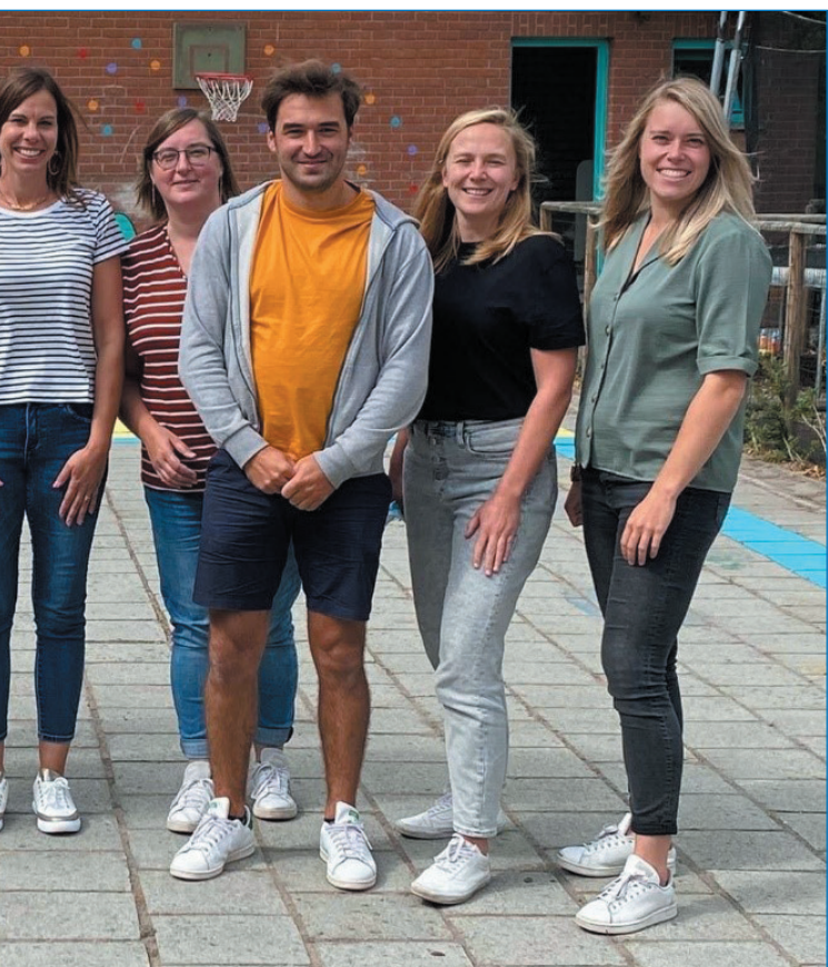
Team BuBaO De Eik

hebben leerlingen het soms wel eens moeilijk. Hiervoor is een specifieke nestwerking geïnstalleerd. Om de nestwerking te kunnen garanderen, wordt er ook op vaste momenten ondersteuning geboden door begeleiders uit Kamrad verblijf. Zij staan samen met het team in om leerlingen die het even moeilijk hebben, tot rust te brengen.