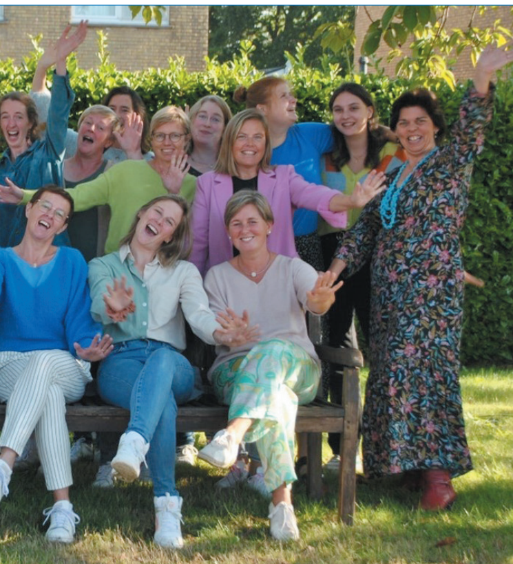
Team BuBaO de Triangel