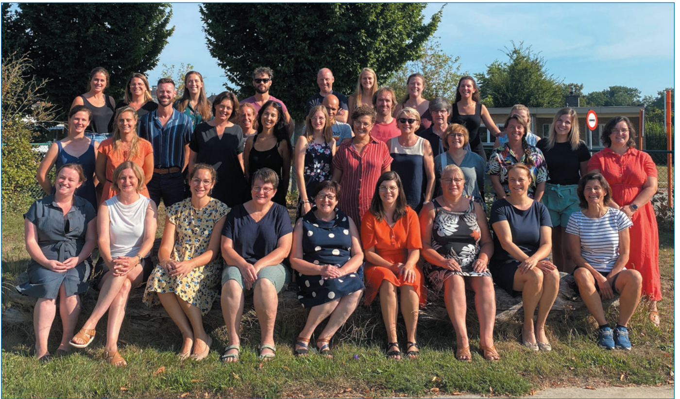
Team BuSO de Triangel